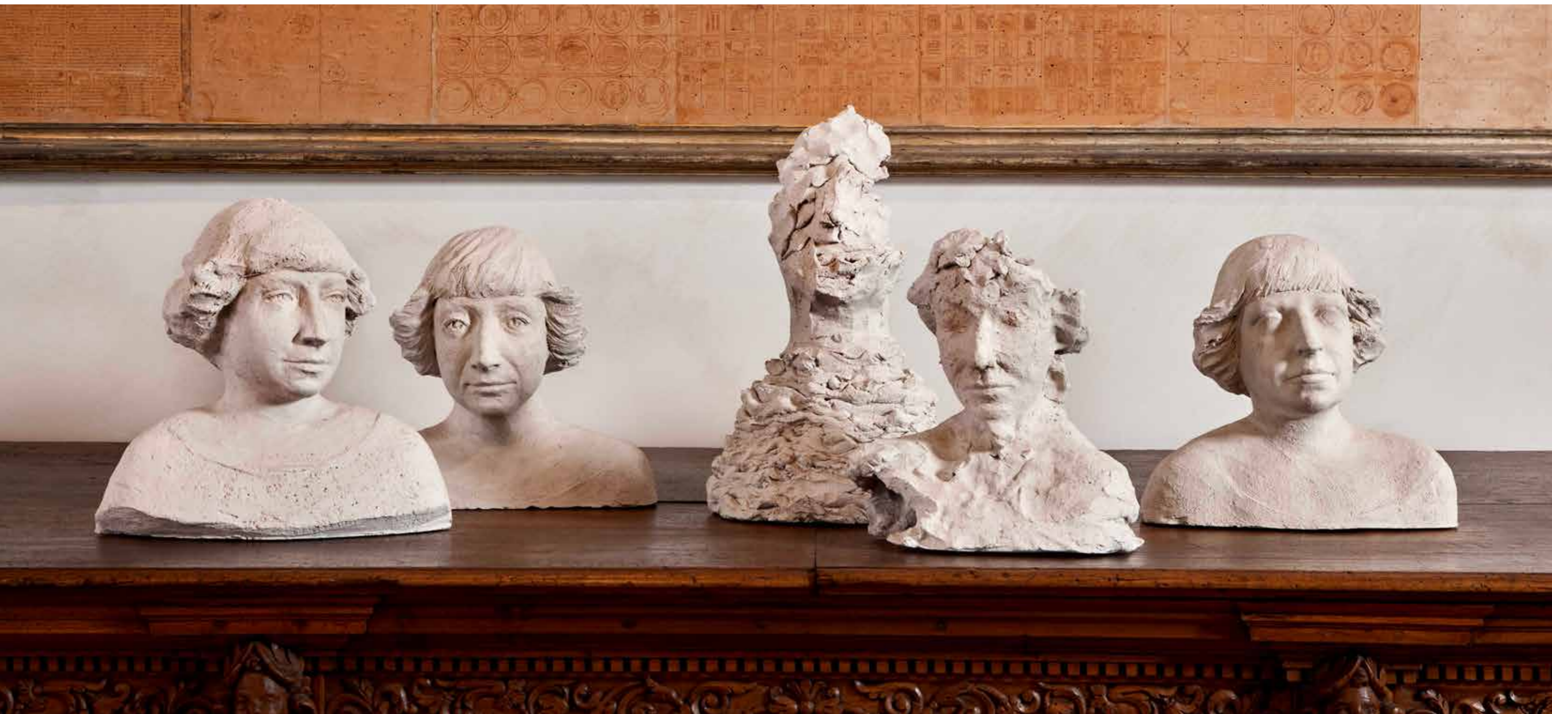
Lei non ama il mare, è tanto piatto e non ci può camminare (Omaggio a Maria Cvetaeva), 2012

Terracotta refrattaria bianca / White refractory terracotta dimensioni variabili / variable dimensions