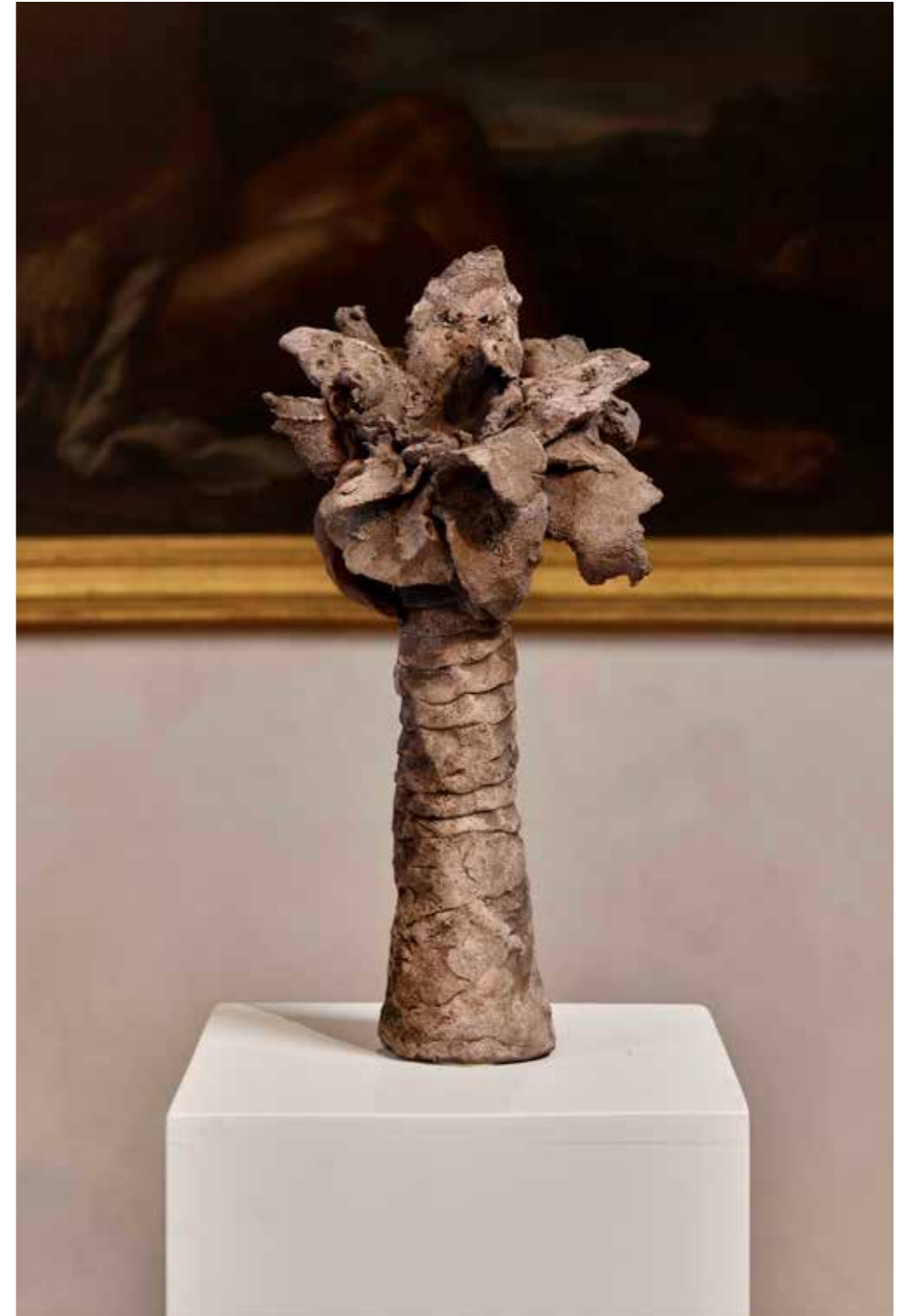
Tre Fiori, 2024

Terracotta nera etrusca / Black Etruscan terracotta 30x14x13 cm, 26x8x6 cm, 40x10x12 cm