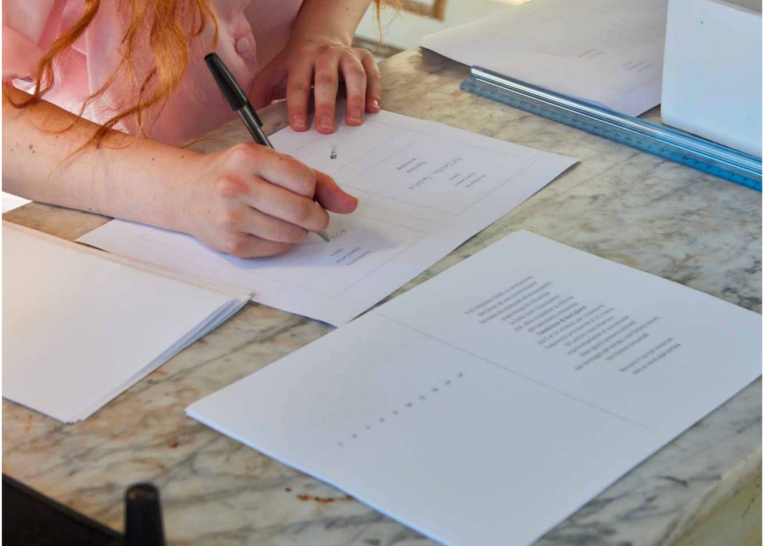
Dieci giorni, 2003-2024