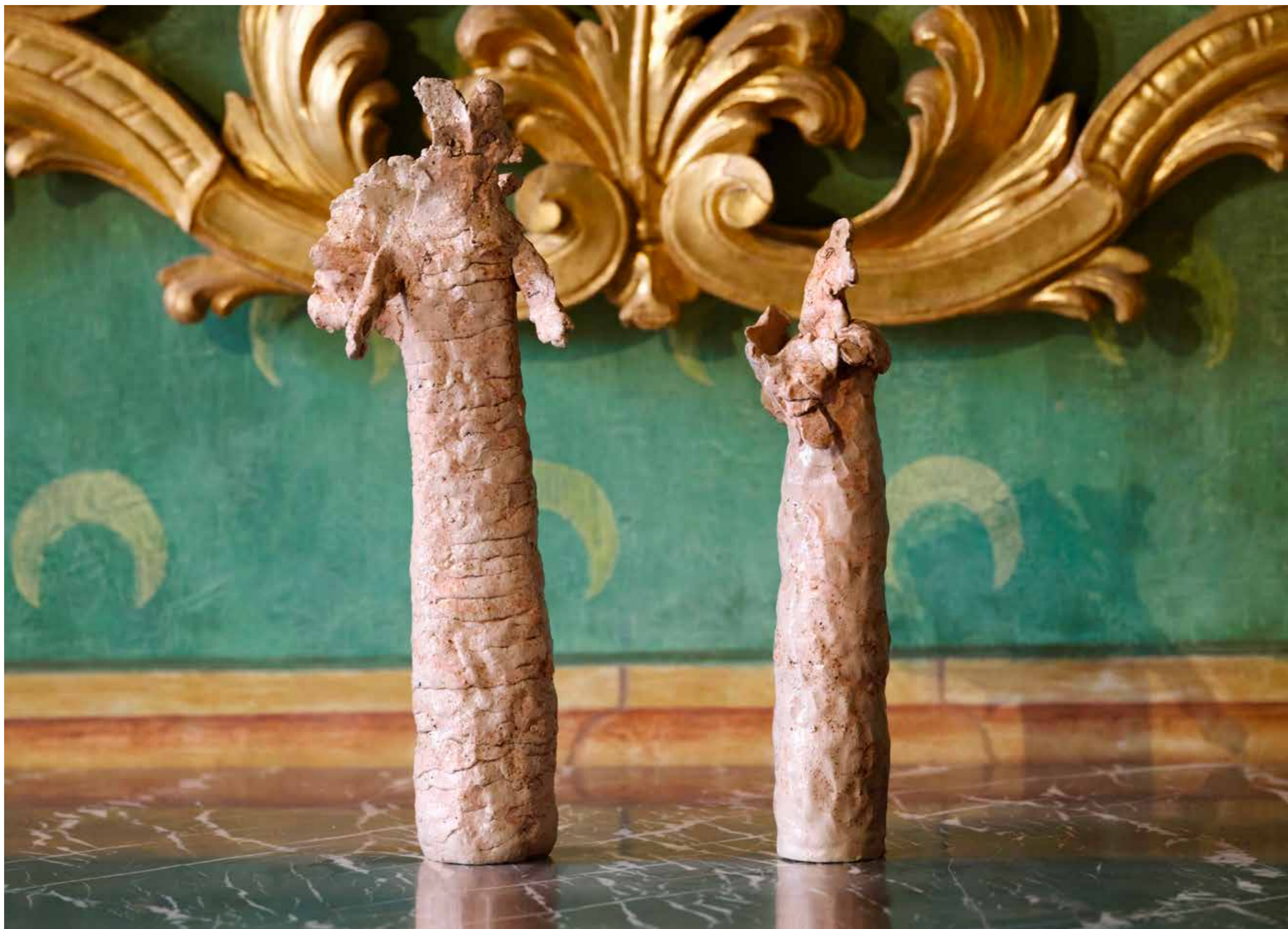
Annunciazione #04, 2024

Grès smaltato con la cenere delle foglie del bosco di Montelucio, (due elementi) / Stoneware glazed with vegetal ash from Montelucio wood (two elements) 42x14x15 cm, 32x10x10 cm