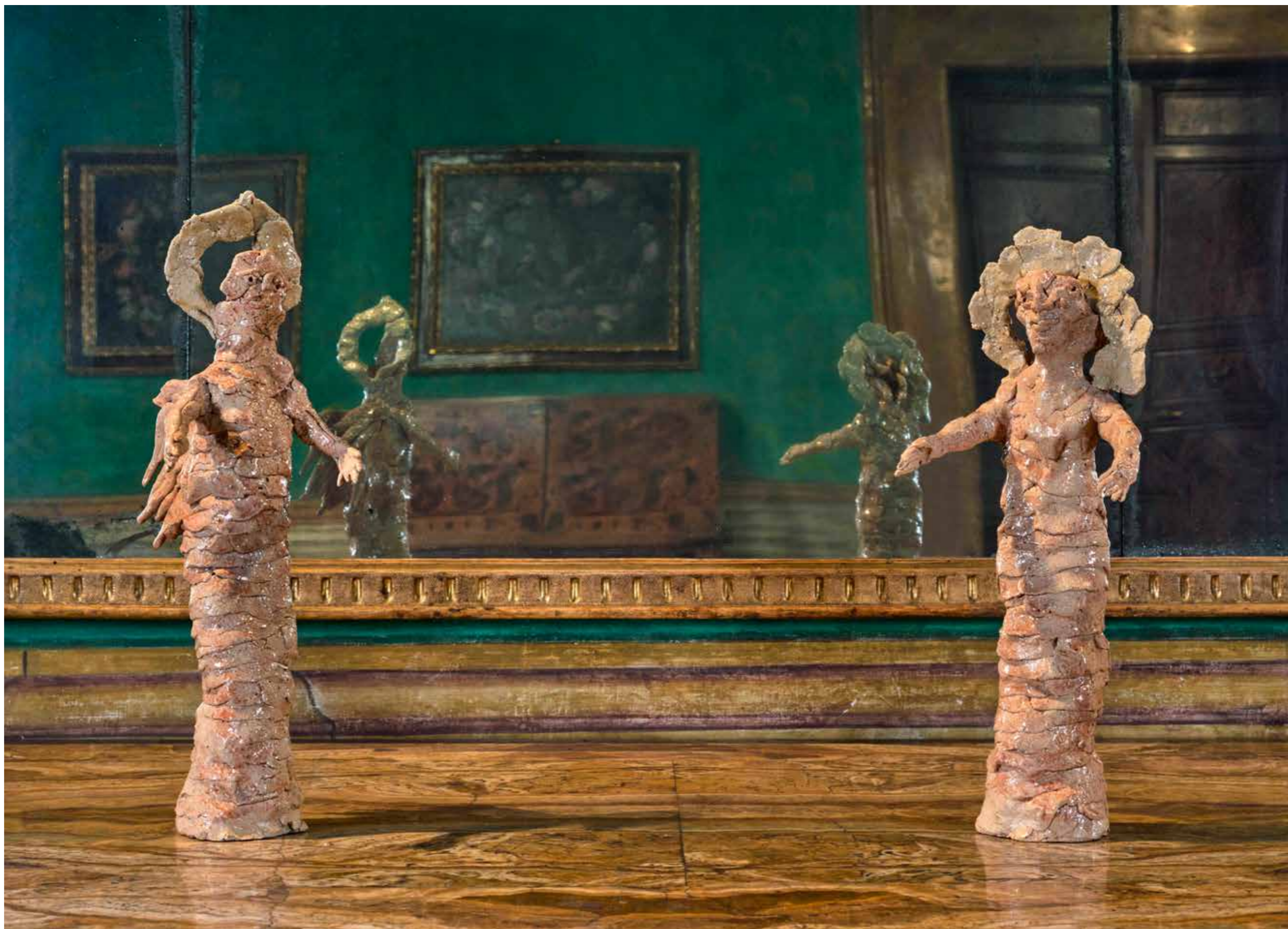
Annunziata #03, 2024

Grès smaltato con la cenere delle foglie del bosco di Montelucio, (due elementi) / Stoneware glazed with vegetal ash from Montelucio wood (two elements) 30x14x15 cm, 33x15x20 cm