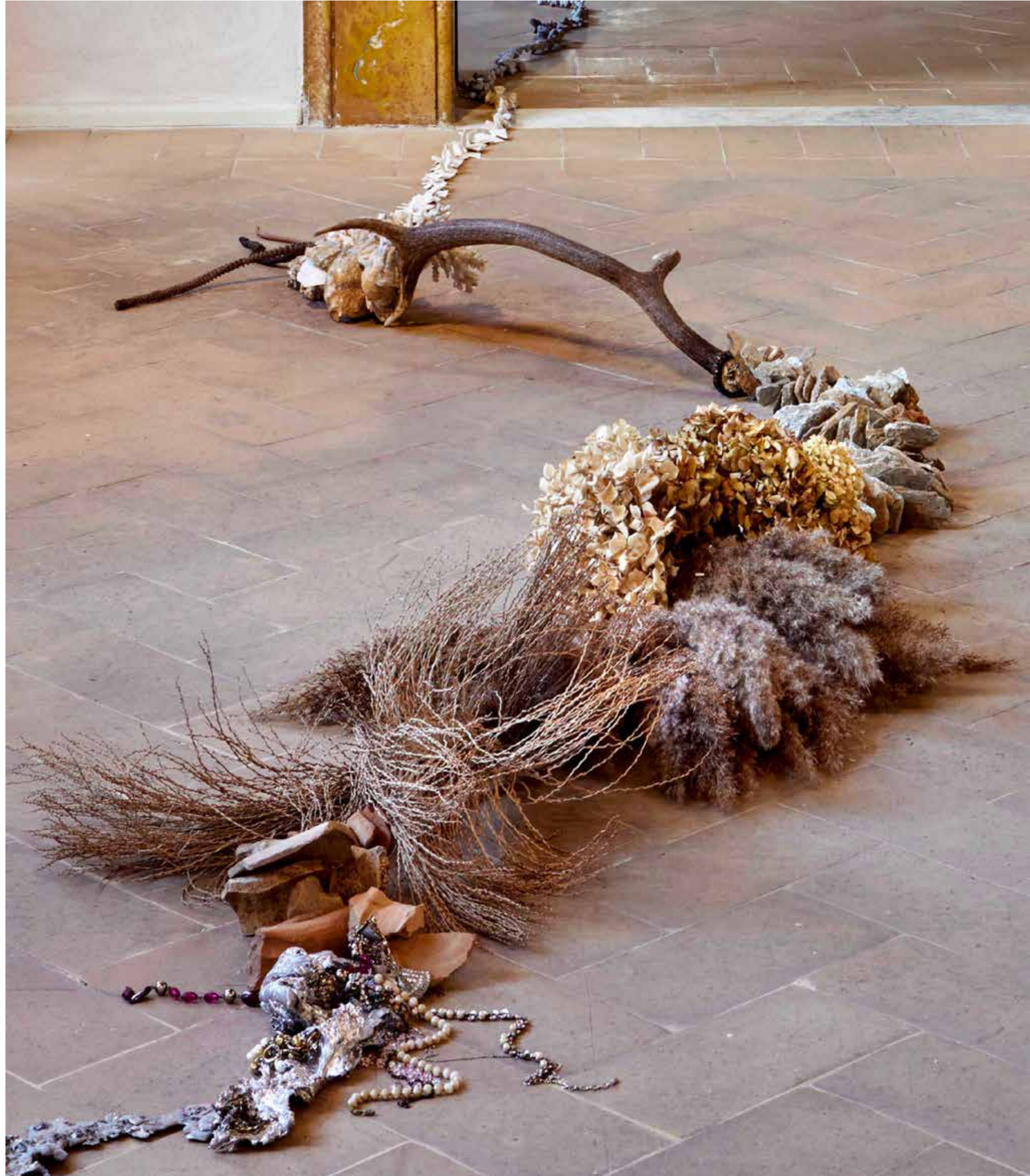
Sister (Serpentessa), 2024

Grès smaltato con cenere vegetale, terracotta policroma, materiali vari / Stoneware glazed with vegetal ash, polychrome terracotta, mixed media 150 m circa/about