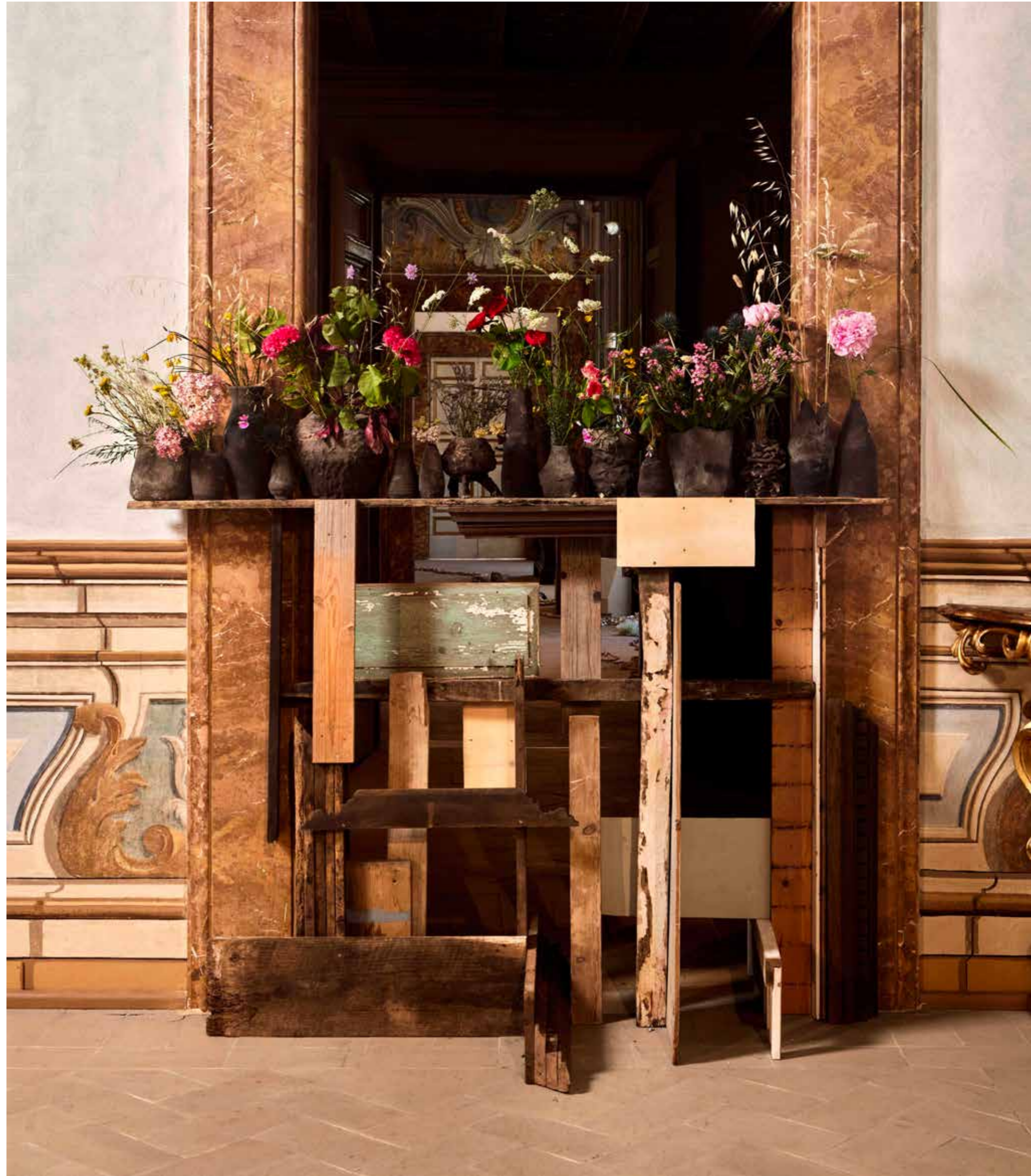
Barricata #02, 2016

Terracotta nera, legno, vegetale fresco / Black terracotta, wood, fresh vegetal matter dimensioni variabili / variable dimensions