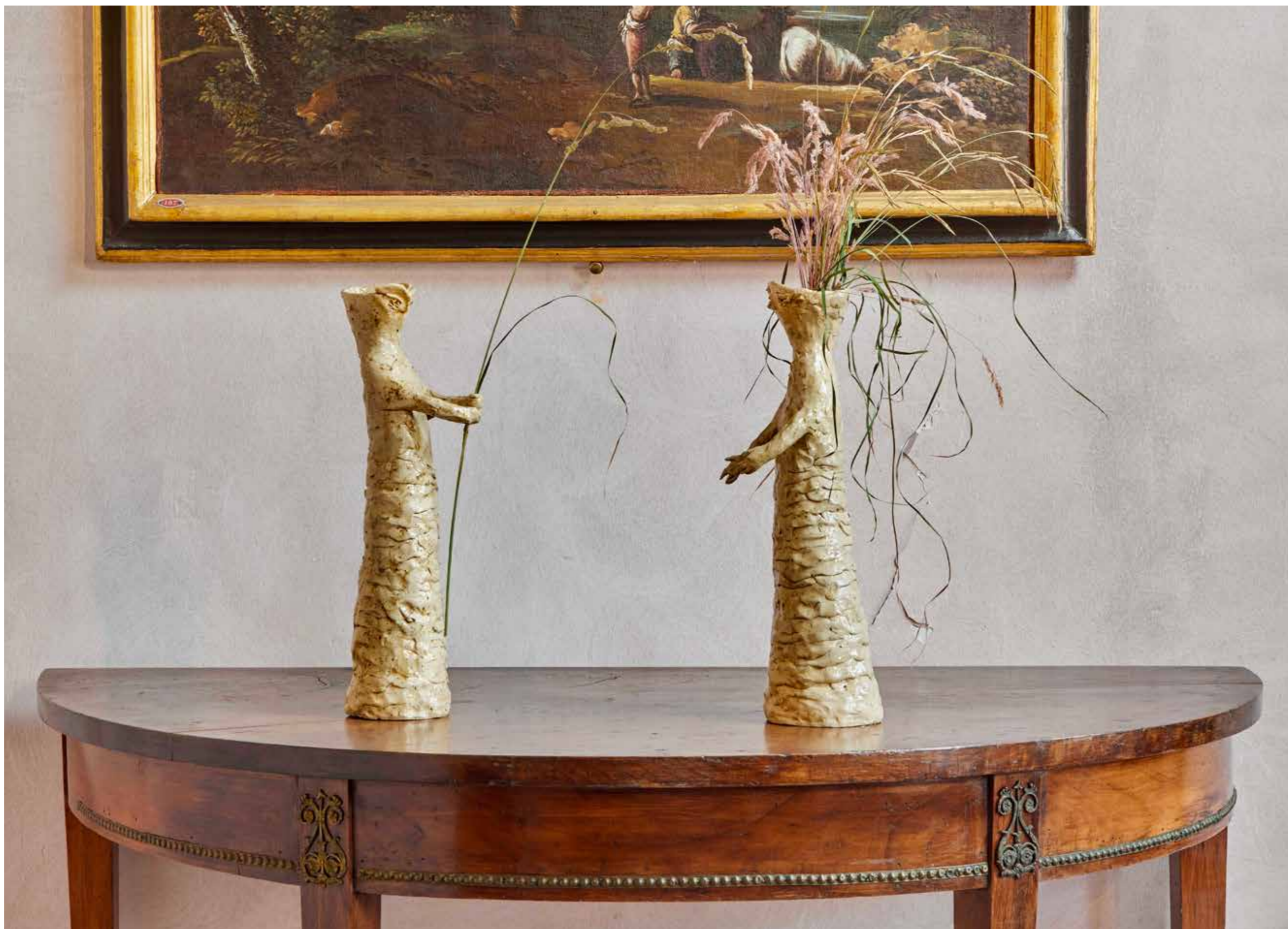
Annunciazione #02, 2024

Grès smaltato con la cenere delle foglie del bosco di Montelucio, vegetale secco / Stoneware glazed with vegetal ash from Montelucio wood, dried vegetal matter 45x14x13 cm ognuna / each