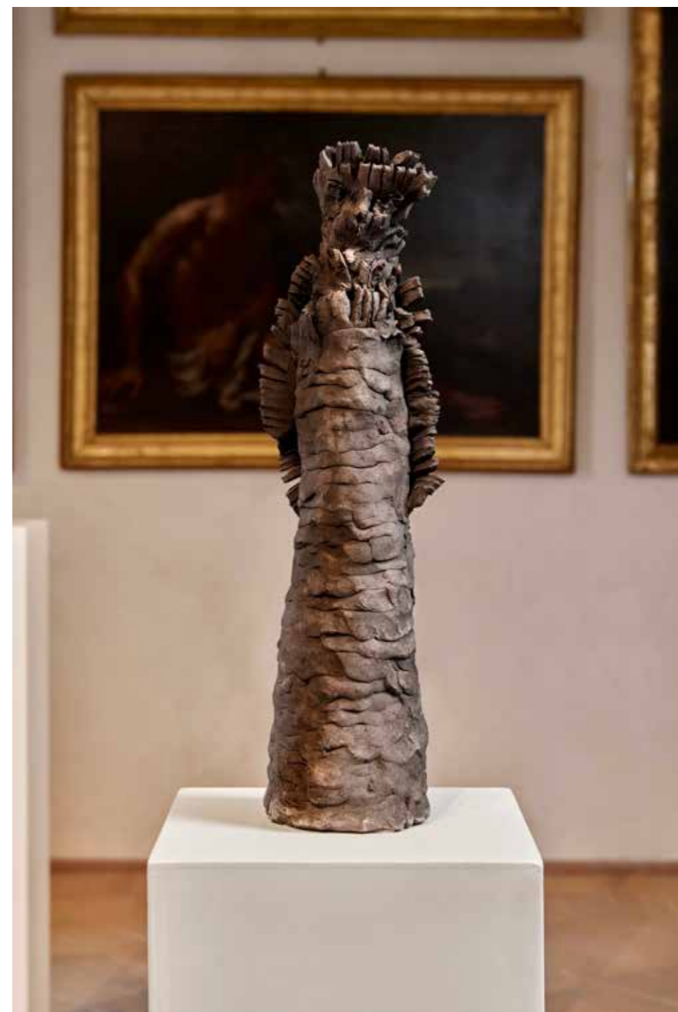
Tre Sante, 2024

Terracotta nera etrusca / Black Etruscan terracotta 32x10x10 cm, 30x10x10 cm, 34x10x10 cm