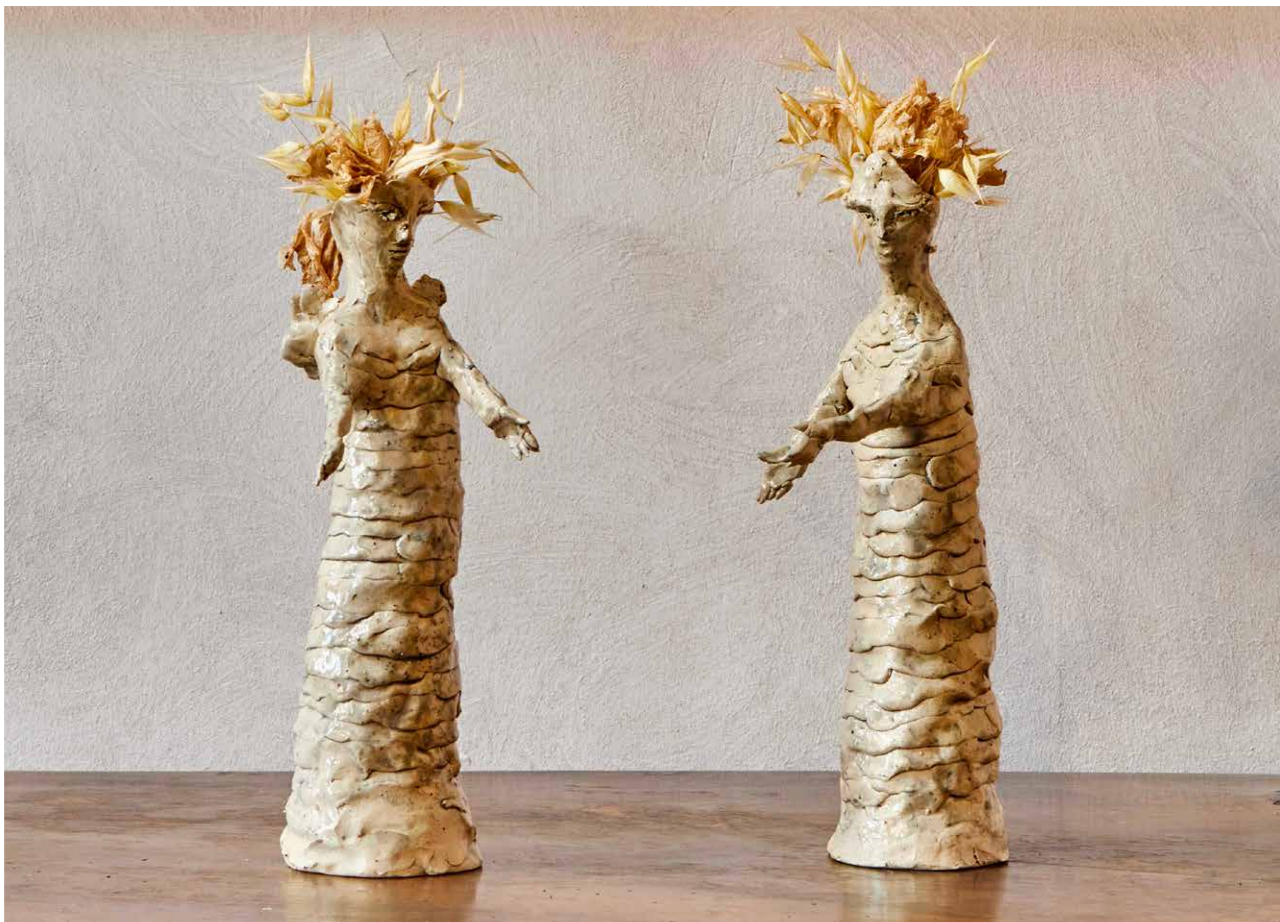
Annunciazione #01, 2024

Grès smaltato con la cenere delle foglie del bosco di Montelucio, vegetale secco / Stoneware glazed with vegetal ash from Montelucio wood, dried vegetal matter 35x14x14 cm ognuna / each