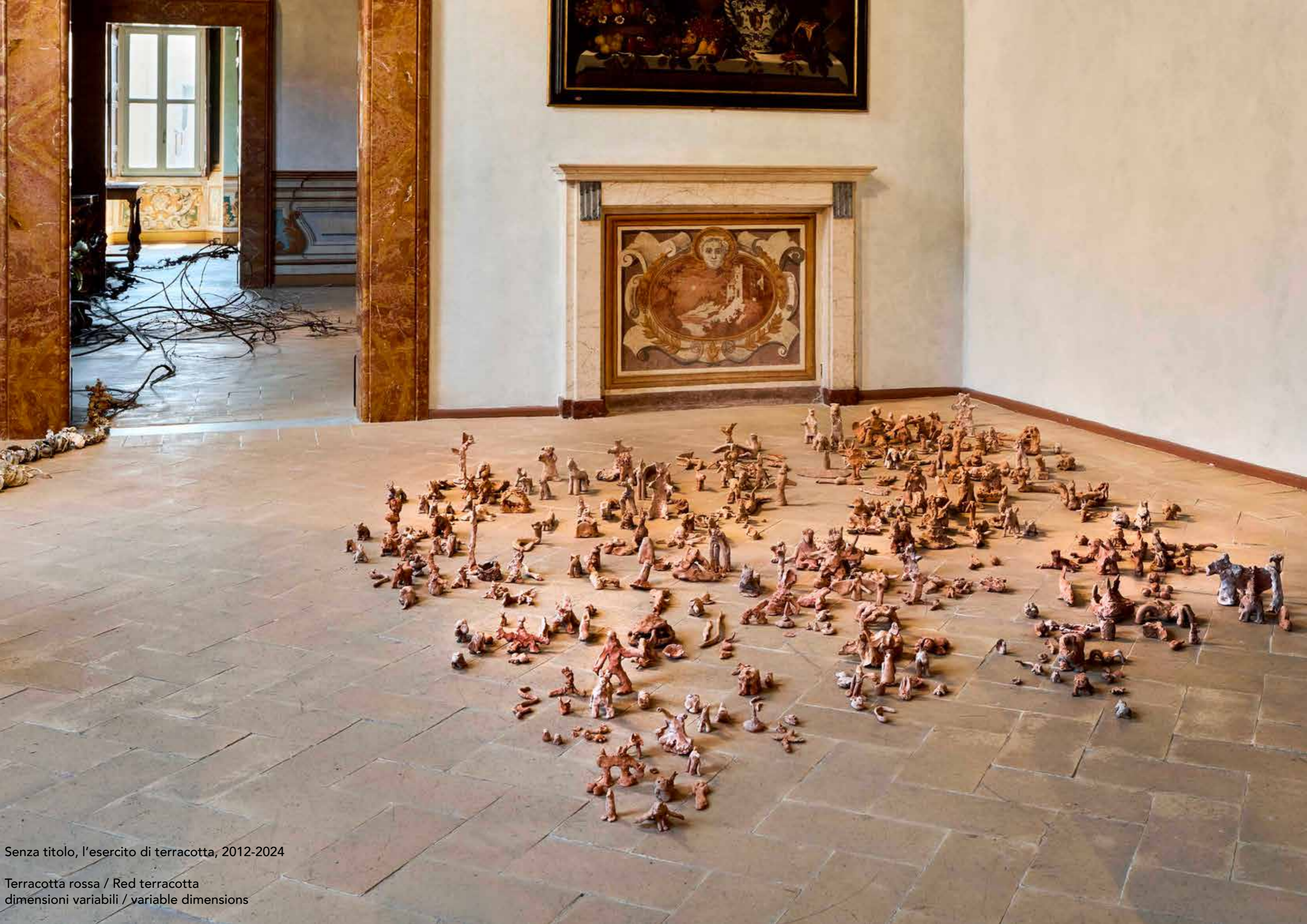
Senza titolo, l'esercito di terracotta, 2012-2024

Terracotta rossa / Red terracotta dimensioni variabili / variable dimensions