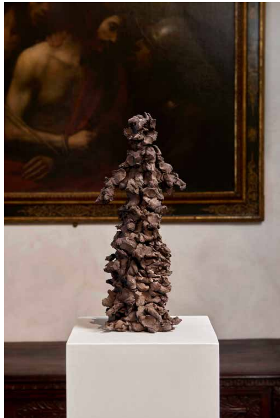
Tre Moire, 2024

Terracotta nera etrusca / Black Etruscan terracotta 30x16x10 cm, 30x16x30 cm, 30x16x10 cm