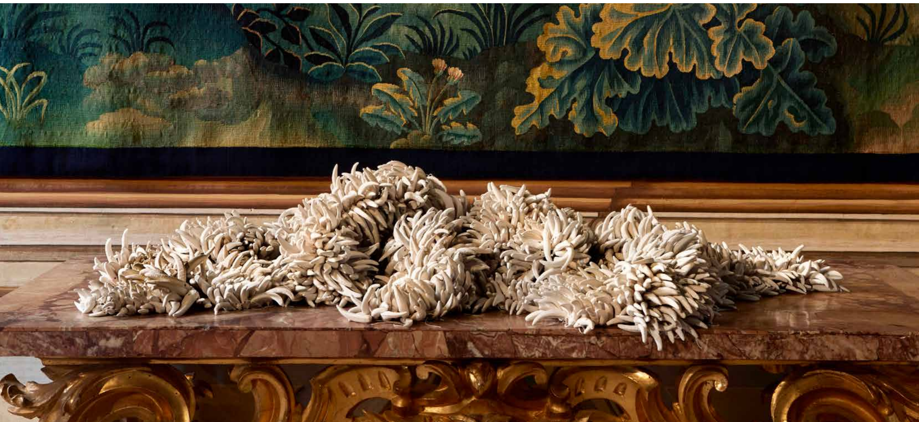
Senza titolo #15, 2014-2024

Terracotta bianca, corda / White terracotta, rope 100x40x20 cm